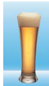
3 dl Bier = 12 Gramm