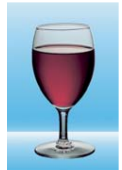
1 dl Rotwein = 10 Gramm