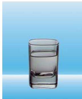
1 Schnaps (0,2 dl) = 7 Gramm