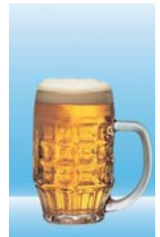
5 dl Bier = 20 Gramm