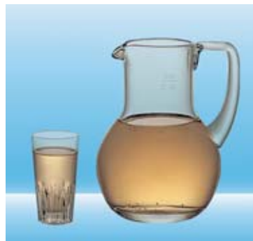
1 dl Weisswein = 10 Gramm