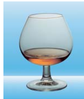
1 grosser Schnaps (0,4 dl) = 14 Gramm